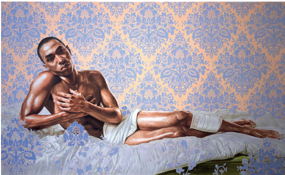
Kehinde Wiley Untitled Down (with bullet), 2011. Oil on paper 24" x 54"

Wie had dat ooit gedacht?! Zwarte mannen en vrouwen afgebeeld als onsterfelijke Griekse Goden, machtige militaire leiders of invloedrijke adellijke figuren. Het is het handelsmerk van de afro-Amerikaanse kunstenaar Kehinde Wiley (1977). Deze kunstenaar schildert statige, invloedrijke figuren, maar zijn modellen hebben geen blanke, maar een zwarte huidskleur. Wiley verandert overigens niet alleen de huidskleur van zijn personages, ook speelt hij met 'maatschappelijke verschillen'. De zwarte mannen en vrouwen die hij portretteert, komen veelal niet uit de 'upper class', maar wonen in de hoofdstedelijke achterstandswijken.