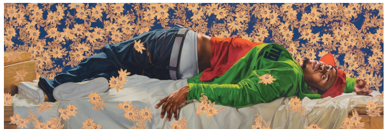
Kehinde Wiley Down (2008).

Wel maakt hij gebruik van verschillende media. Hij schildert vooral, maar gebruikt ook fotografie en lichtinstallaties. Volgens The New York Times is zijn werk uniek. Dat zijn modellen hedendaagse hip-hop outfits dragen, maar tegelijkertijd 'historische goddelijke poses' aannemen, zorgt voor een vervreemdend effect. Bovendien zijn de werken, met afmetingen van twee bij twee meter, levensecht en indrukwekkend. Meer onderscheid tussen de verschillende