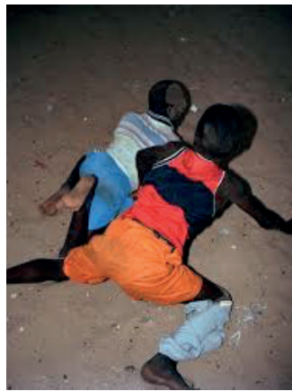
Viviane Sassen Free Fall (2014)