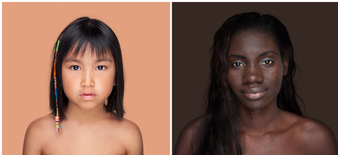
PANTONE 70-5 C